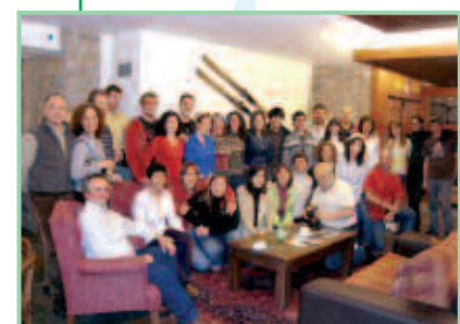
Foto de portada: CEIP "Vicente Aleixandre", de Aranjuez